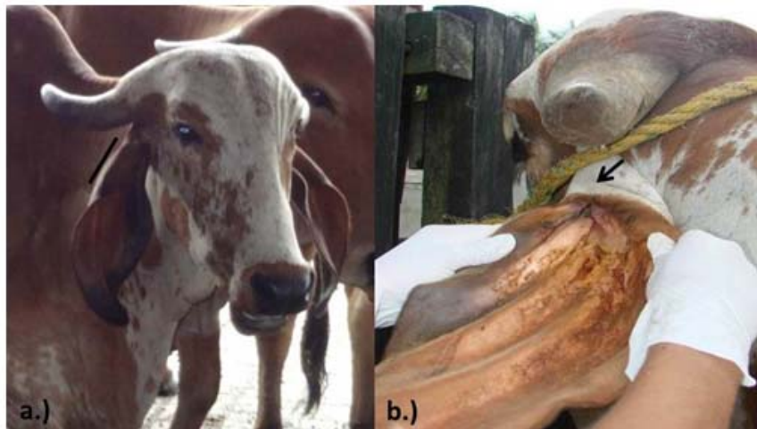
Figura 1. Bovinos de la raza Gyr. a.) Obsérvese la conformación tubular de pabellón auricular (barra), lo que favorece la retención de cerumen. b.) Nótese, que al abrir la oreja queda un área que impide la entrada de luz (flecha), lo que proporciona un ambiente propicio para la reproducción y permanencia del parásito.

La otitis parasitaria bovina es causada por nematodos del género Rhabditis , se presenta principalmente en bovinos de la raza Gyr e Indubrasil. La raza Gyr parece estar predispuesta a la enfermedad en comparación con otras razas, debido a la conformación anatómica del pabellón auricular, el cual es alargado, pendulante, en forma tubular, con su porción superior enrollada sobre sí misma, abriéndose gradualmente hacia fuera, curvándose hacia adentro, lo que favorece la retención de cerumen, proporcionando así un ambiente propicio para la reproducción y permanencia del parásito (Leite et al., 1993; Vieira et al., 1998; Vieira et al., 2001) (Figura 1).