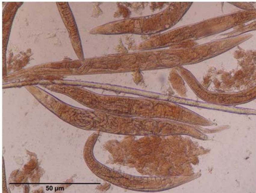
Figura 4. Rhabditis bovis , observado en el microscopio. Obsérvese la gran cantidad de hembras de Rhabditis gestantes con larvas en su interior. 10x.