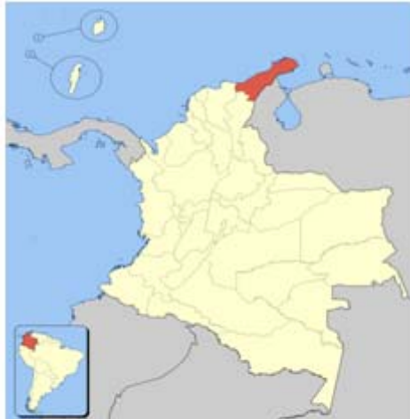
Figura 1. Mapa de ubicación de La Guajira. Colombia